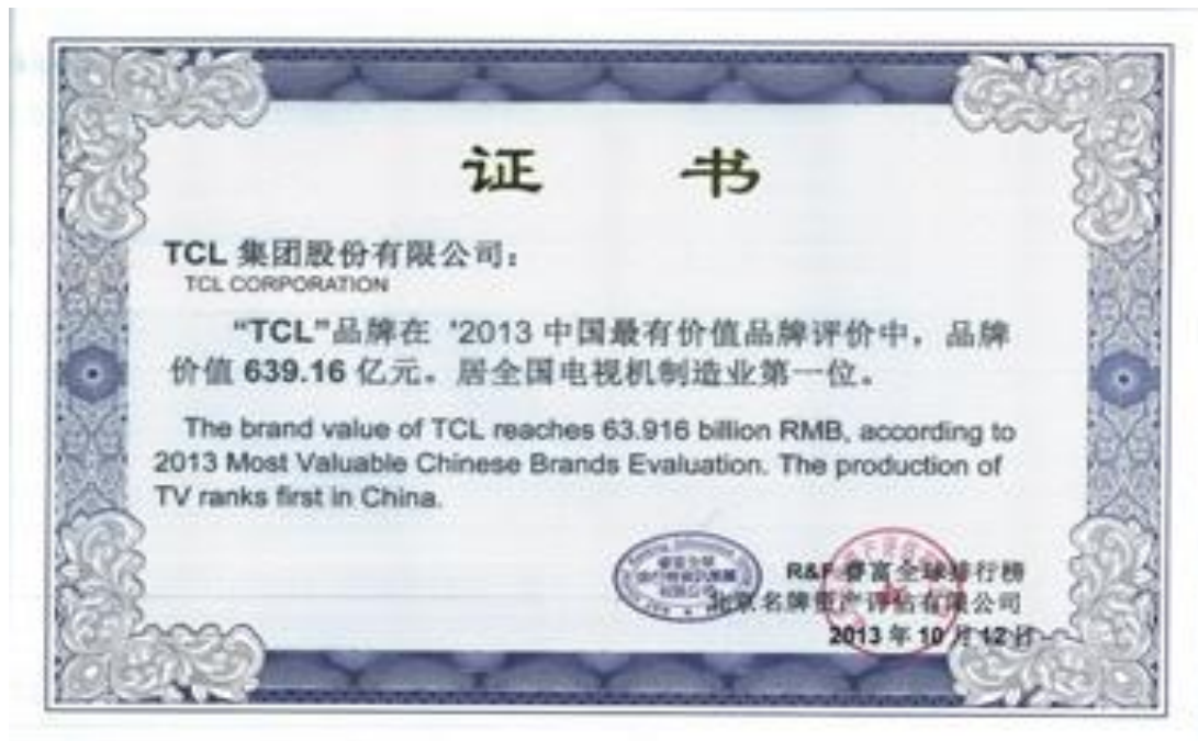
TCL 集团 2013 年品牌价值证书

随着TCL集团加大在全球市场的战略布局与资源整合力度，TCL品牌的行业地位和品牌影响力持续提升，已经成为全球消费电子市场上的主要力量。未来，TCL将会加速向“千亿企业”、“世界500强企业”的战略目标迈进，力争早日实现中国品牌的世界梦。