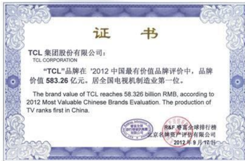
TCL 集团 2012 年品牌价值证书

中国最有价值品牌专业分析师指出，在全球产业格局重新洗牌之际，中国品牌建设正伴随互联网及其电子商务业的发展迅速提升，随着80后、90后成为消费主力军，品牌的市场竞争将更为充分和彻底。作为知名消费品制造企业，TCL坚持创新，加速转型并实施产业升级，品牌竞争力不断增强，代表了中国品牌建设与发展的成就。在“中国最具价值品牌”评选中，TCL已经连续7年保持中国电视机制造业的第一品牌。